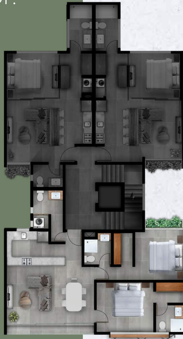
Distribución de planta