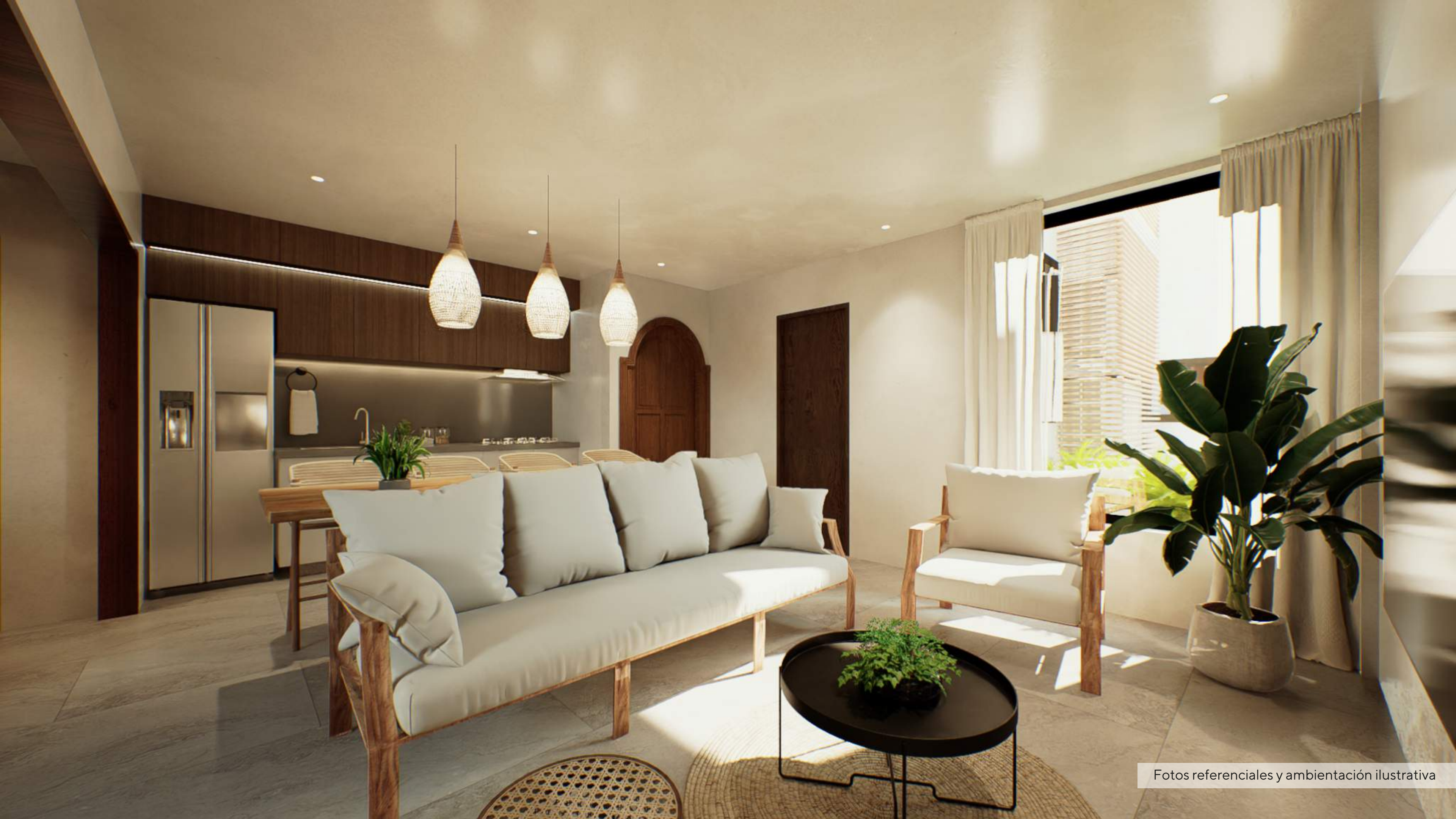
Fotos referenciales y ambientación ilustrativa