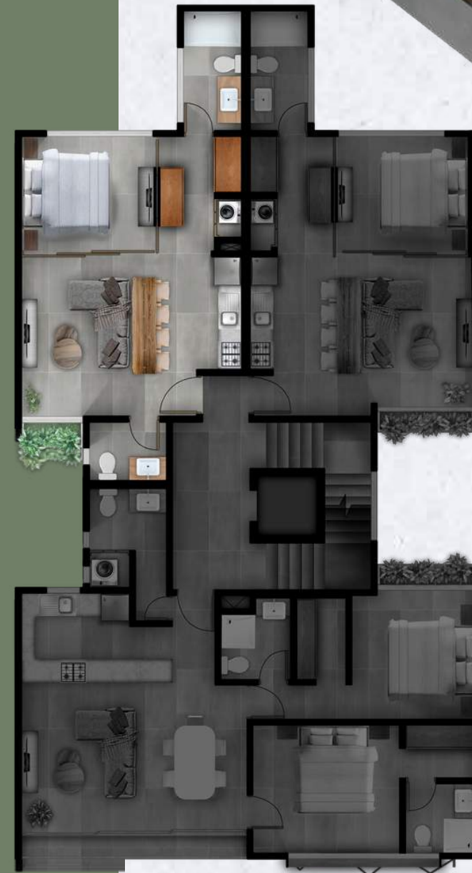
Distribución de planta